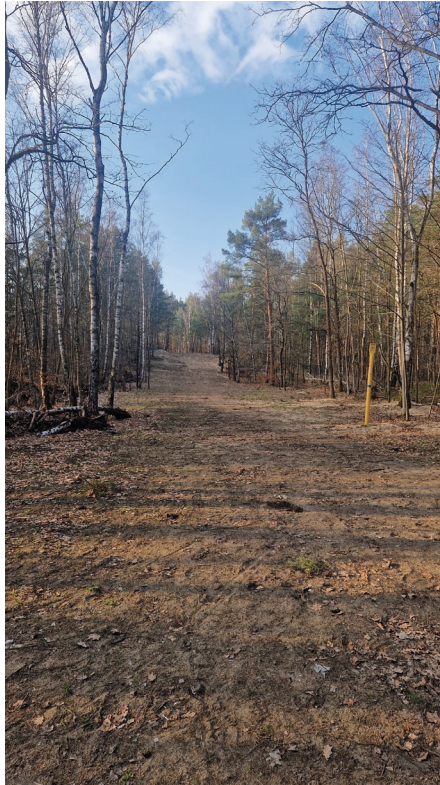
Neue Schneise