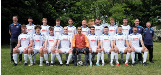
Die Erste Herrenmannschaft

Das Ausscheiden aus dem Pokal gegen Wacker Leuben ist für uns kein Beinbruch und war in der Rückschau des Spiels für den Gegner nicht unverdient. Das Spiel hat gezeigt, dass wir mithalten können. Aber es zeigt auch: Wir benötigen noch etwas Zeit, um auch solche namentlich gut besetzten Mannschaften zu schlagen. Daran arbeiten wir in der nächsten Zeit, richten den Fokus jetzt aber auf die Liga.