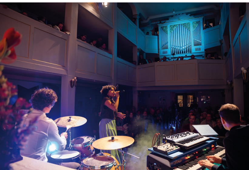
Konzert in der Alten Kirche