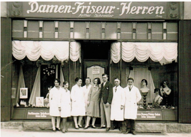
Salon Schneider 1926